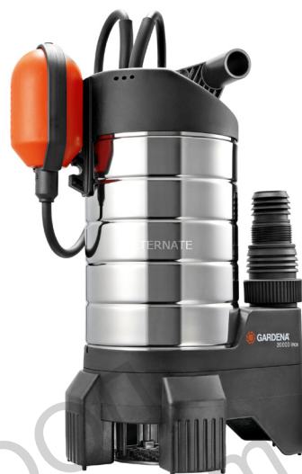
21000 inox Art. 1787